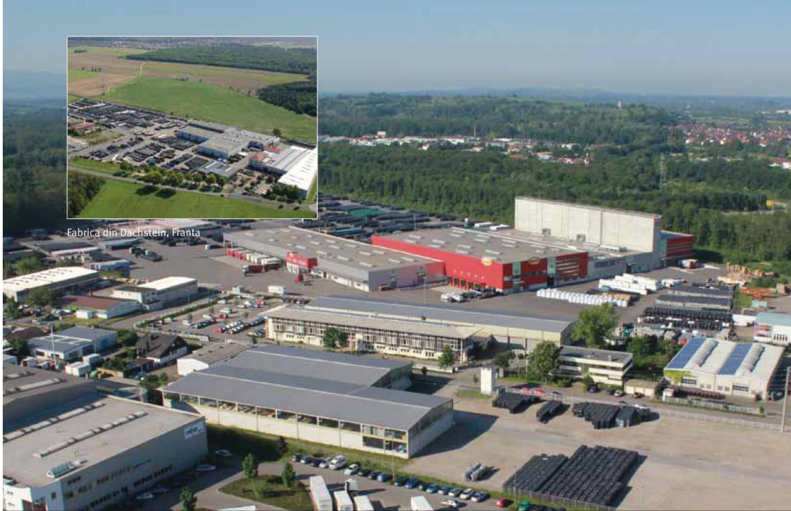
Fabrica din Dachstein, Franța