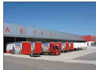
Centrul logistic din Teningen