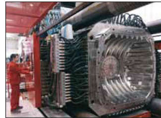
Cea ma mare masina de injectie din lume

Caldura generata in timpul pocesului de productie este procesata de un sistem de recuperare si este utilizata la incalzirea facilitatilor de productie si al birourilor.