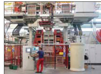
Blow moulding process