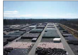
Depozitul din Teningen, Germania

Mai mult de 100000 de clienti multumiti beneficiaza de sistemele de recuperare a apei pluviale produse de GRAF.